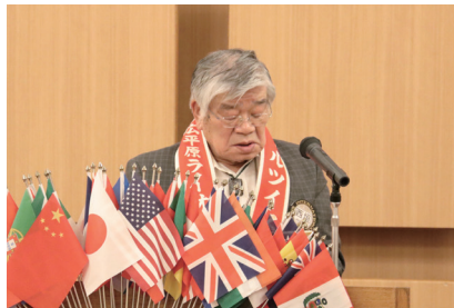
テーマータールツイスター報告 西垣L