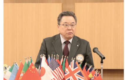
閉会ゴング 平原LCのチャーターメンバーの 元吉田Lの訃報を伝えました。