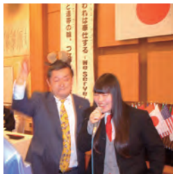
高瀬Lのダンス付 歌は西垣Lのお嬢様