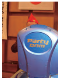
アングルが最悪 松山L