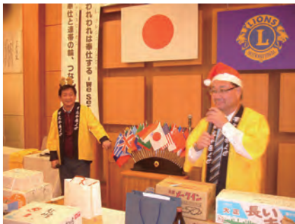
オークションを値を競り上げる猫本L