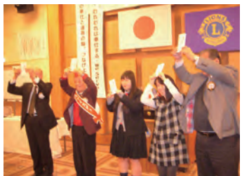
カラオケ参加者の皆様ありがと〜!