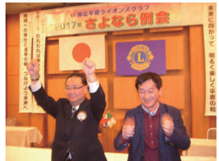
オークションで活躍した猫本L、橋本Lのローア