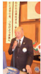
艶のある低音 大江L