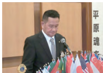
ライオンズの誓い 星L