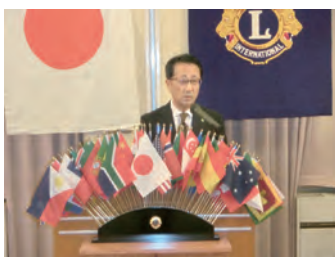
カレンダーの配布の報告 テーマー太田L