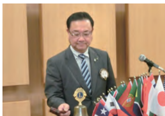
閉会ゴング 猫本会長