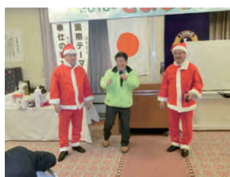
オークションで大活躍