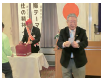
残りものに福！三谷L