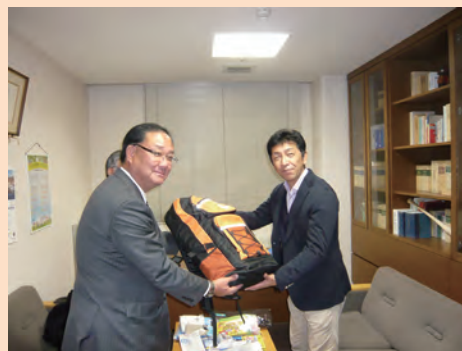
ラジオ・懐中電灯・浄水器等防災グッズを贈呈しました。