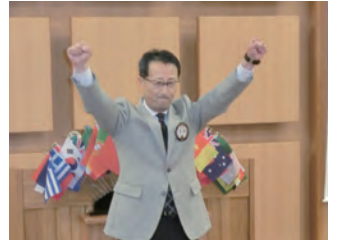
五穀豊穡を祈念し太田Lの ライオンズローア