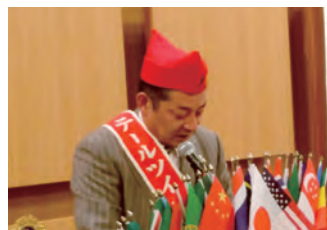
高瀬Lのテール報告