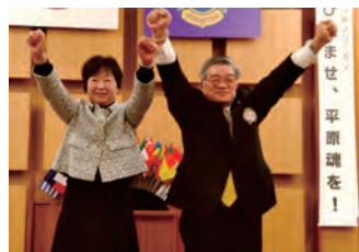
さくら、平原の幹事のローア