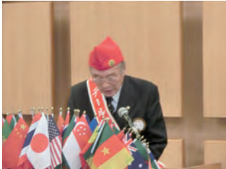
テールツイスター報告 大江L