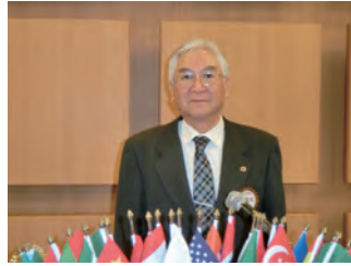
高草木Lのライオンズの誓い