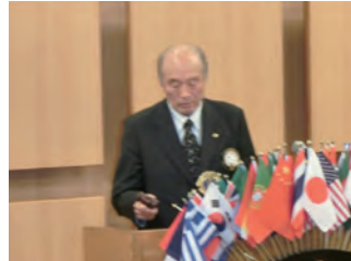
大江Lの閉会ゴング