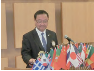
開会ゴングを打つ猫本会長