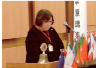
さくらLC 萩原Lのライオンズの誓い