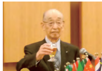
齋藤Lのウィサーブ