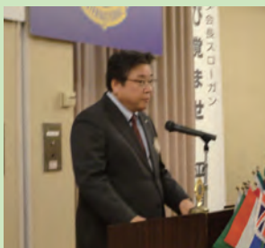
ライオンズの誓い 矢吹L