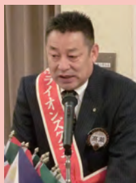
アクティビティ(副) 高瀬L