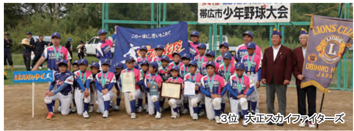
3位 大正スカイファイターズ