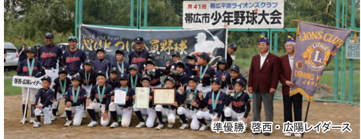
準優勝 啓西・広陽レイダース