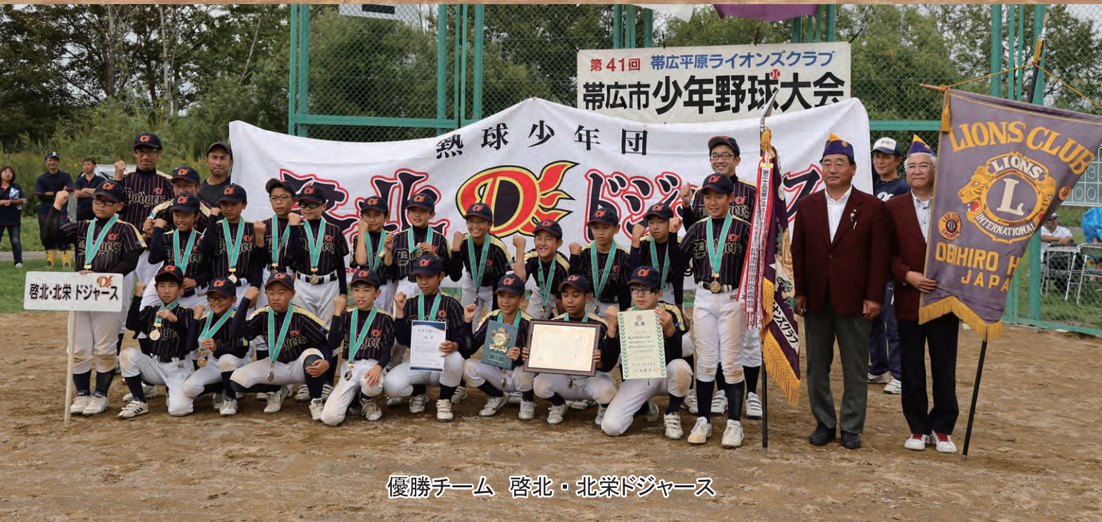
優勝チーム 啓北・北栄ドジャース