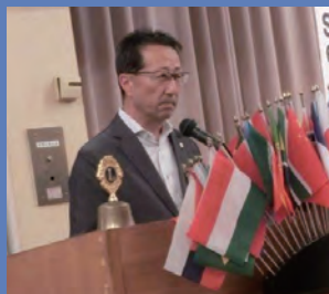
ライオンズの誓い 太田L