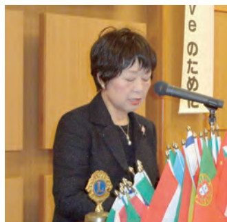
幹事報告 船迫 L