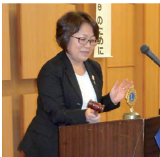
閉会ゴング 桜並木会長代理