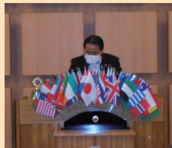
献血の呼びかけの案内 松浦 L