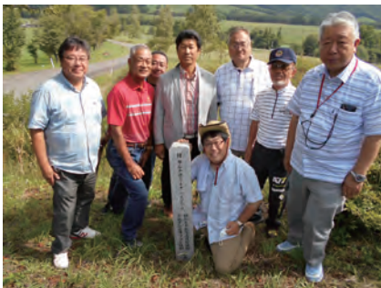
平原 LC の植樹を記した碑