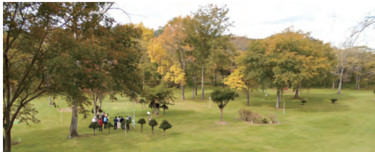
紅葉のパークゴルフ場