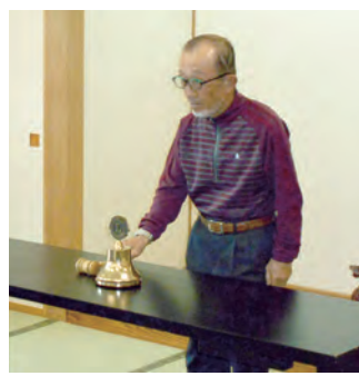
松山Lの閉会ゴング