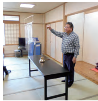
矢吹Lのウィザープ