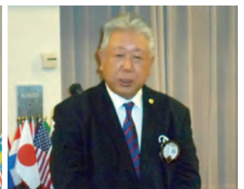
ローアの発声 三谷L