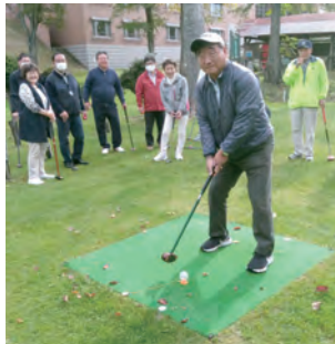
田邊Lの渾身の一打！