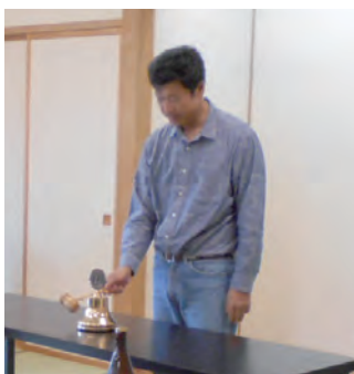
例会開会のゴング