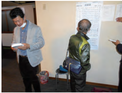
帯広平原麻雀大会成績表