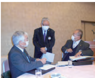
例会進行の打合せ