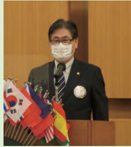
清野Lのライオンズの誓い