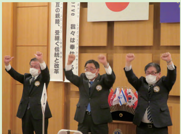
2021年最後のライオンズローア