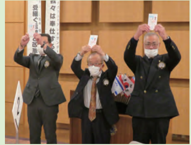
2021年の還暦・喜寿・古希のL