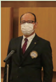
歳末義援金報告 池田L