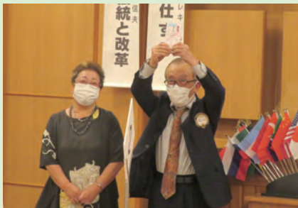
金婚式祝福 松山L夫妻